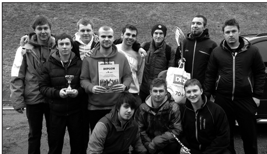
Sestava FBC Volary

V sobotu 22. února se v Horní Plané konal 1. ročník Hornoplánského poháru ve florbale, který se odehrál ve zdejší sportovní hale. O Hornoplánský pohár se utkali také florbalisté z Volar. Pro volarské byl tento turnaj vůbec první příležitostí poměřit síly s dalšími týmy z jihočeského kraje, protože doposud hráli pouze pro zábavu v tělocvičně na „malé škole“ ve Volarech. Celkem se turnaje zúčastnilo 5 mužstev – Horní Planá, Nová Pec, Frymburk A, Frymburk B a Volary. Absence možnosti natrénovat hru v pěti lidech na velkém hřišti se podepsala na výsledku prvního utkání proti Horní Plané, který volarští prohráli v poměru 3:1. Tým Volar si však na nové podmínky rychle zvyknul a další dva zápasy proti Frymburku B a Nové Peci vyhrál vysoko 5:0 a 7:0. V posledním zápase Volary narazily na budoucího vítěze celého turnaje – Frymburk A, kterému podlehly 3:1. Bojovnost, šikovnost a především radost ze hry zdobily výkon týmu z Volar, který se díky smyslu